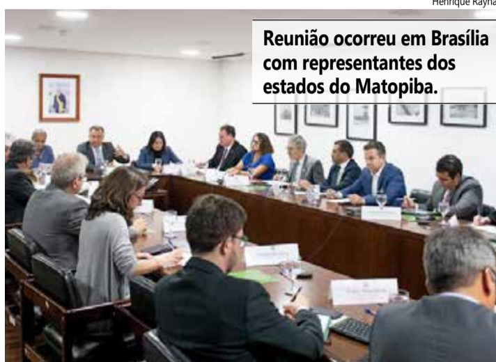
Reunião ocorreu em Brasília com representantes dos estados do Matopiba.

O encontro foi promovido pelo ministro da Casa Civil, Rui Costa; pela ministra do Meio Ambiente e Mudança do Clima, Marina Silva; e pelo ministro da Agricultura e Pecuária, Carlos Fávaro. Além do governador Wanderlei Barbosa, que esteve acompanhado do