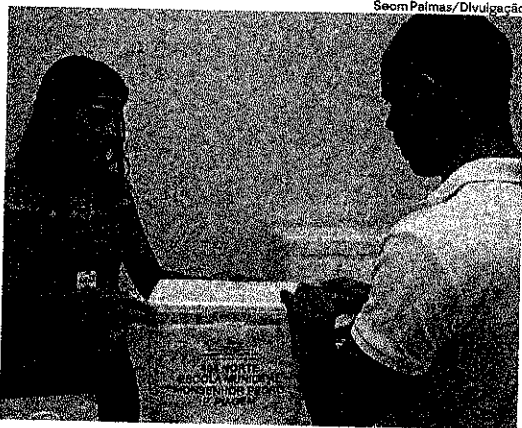
Servidores da Prefeitura fizeram a separação das doses da vacina

CAMPANHA TEVE INÍCIO NO ÚLTIMO DIA 20 DE MARÇO E SEGUI ATÉ O PRÓXIMO DIA 20 DE ABRIL, COM META DE IMUNIZAR 30 MIL ANIMAIS DOMÉSTICOS